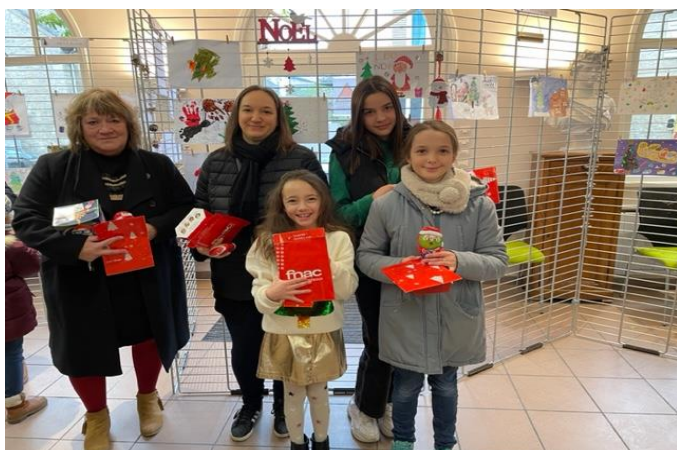
Les 5 lauréates dont l'une était représentée par sa mamie