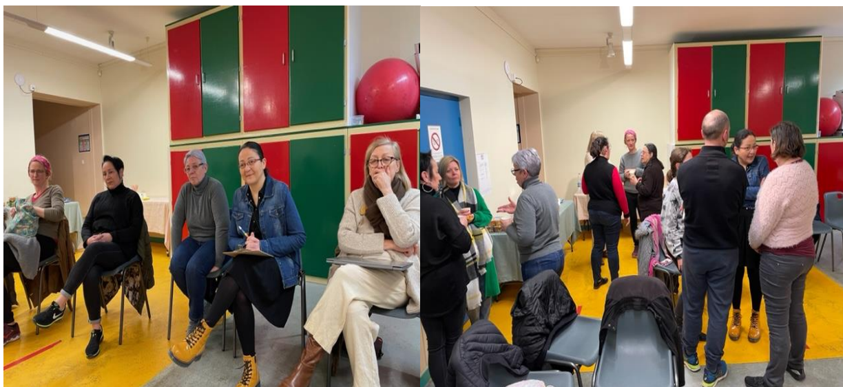
Moment de concentration et d'écoute des lectures de participants – Instant de collation et du verre de l'amitié

Un grand merci à toutes et à tous pour votre participation.