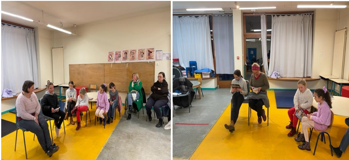
Moment de concentration et de lecture

Cette édition 2023, une première pour Mello, est définie au niveau national sur le thème « frissons, chair de poule, peur, ogres et sorcières... » et a eu lieu le samedi 4 mars à l'école de Mello. L'entrée est libre et gratuite pour tout public (enfants, adolescents et adultes).