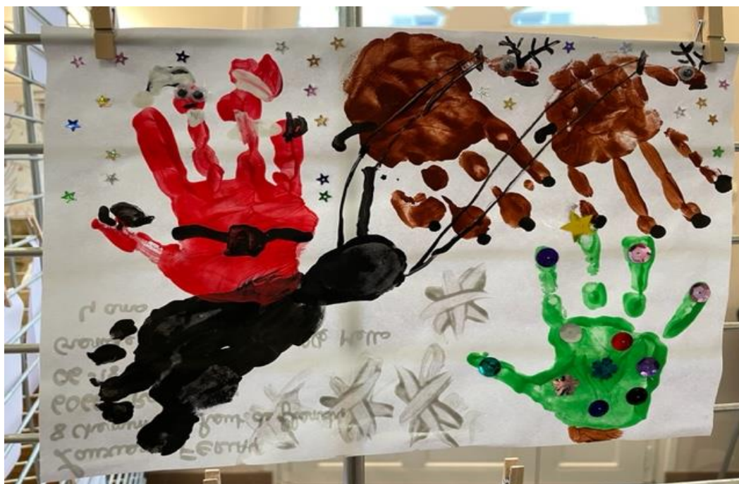
Lauréat du concours de dessins « Noël 2022 » de Mello