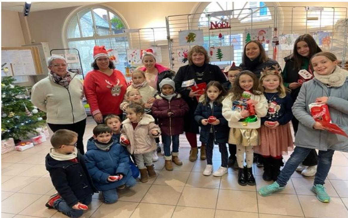
Les participants au concours de dessins édition 2022 et le Maire de Mello